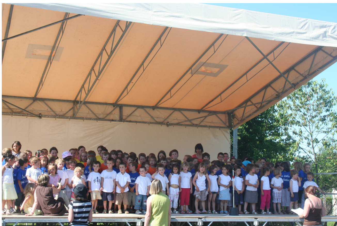
Samedi 22 juin 2008 - Kermesse du RPI

Le bureau de l'APE vous souhaite une bonne année 2009 !