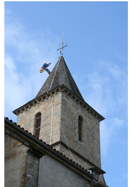
03 juillet 2008 - Pose d'un paratonnerre sur le clocher de l'église