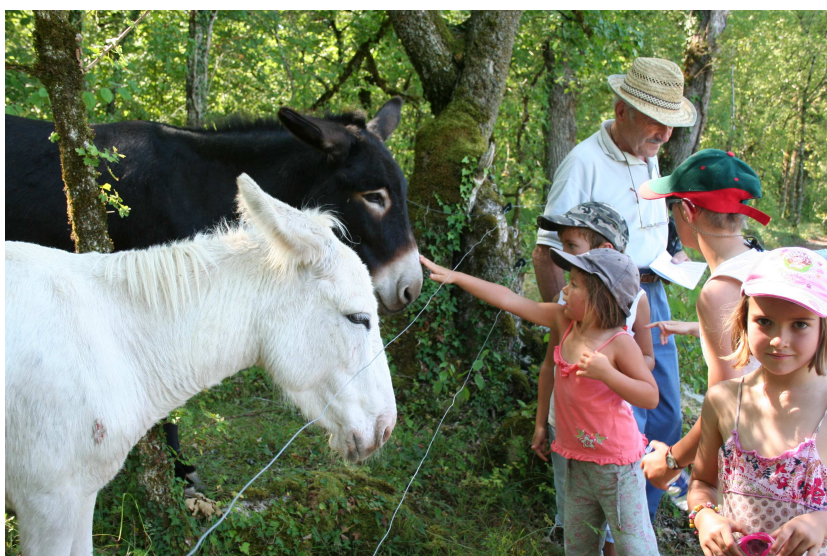
Sortie inter générations du 30 août, aux P'tits Equins

Et nous voilà le 1 er dimanche de mars – Assemblée Générale, elle réunit les adhérents, sympathisants (et nous souhaitons la venue de quelques amis) passage obligé qui voit la distribution du timbre de l'année avec un joli crayon offert par le club avec l'inscription « Club de Miers-les-Eaux », afin que nul n'ignore ou n'oublie que la source Salmière est sur notre territoire !