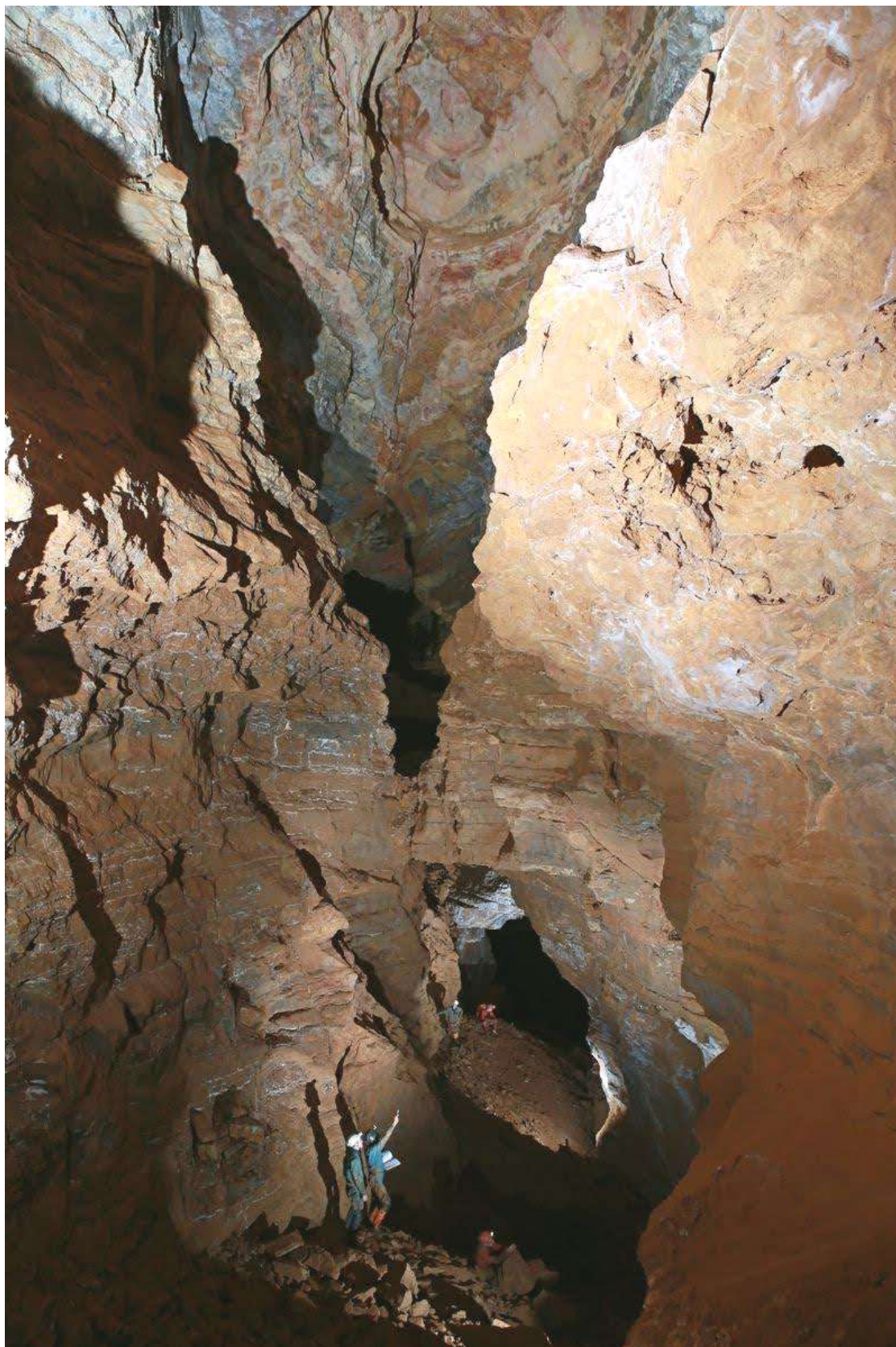
La galerie au-dessus du bivouac