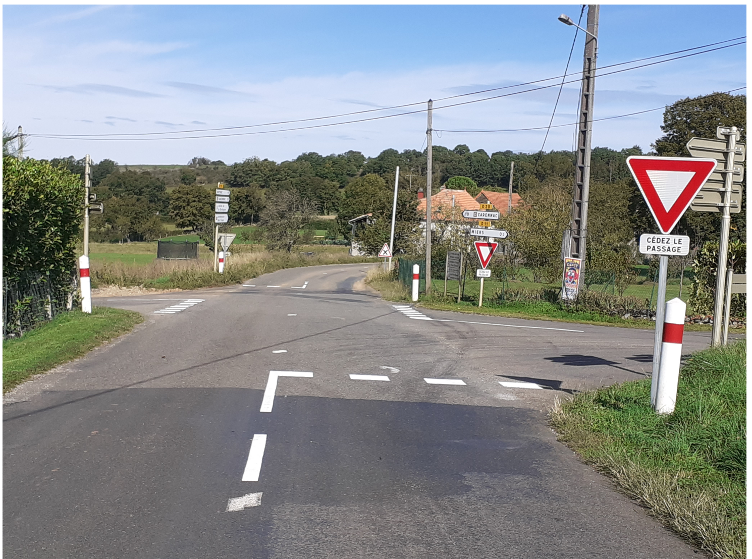
Le carrefour des Espérières a été modifié afin de diminuer la vitesse à proximité d'une zone d'habitations.