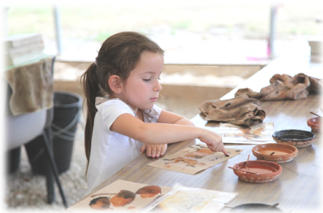
Une jeune artiste à l'œuvre

Plus d'informations au 06 16 26 74 35 ou sur www.archeositedesfieux.com .