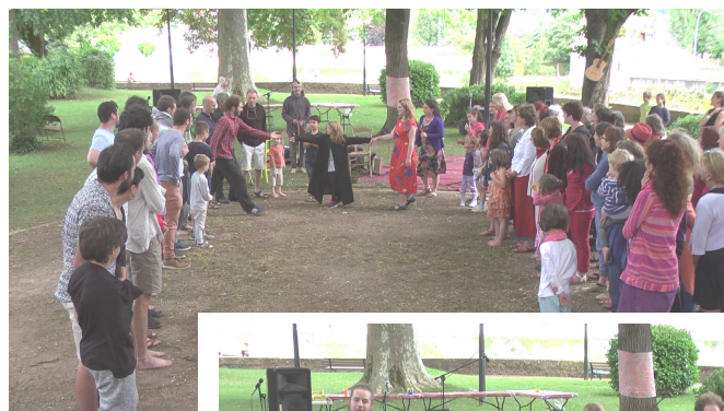
Le P'tit Bal