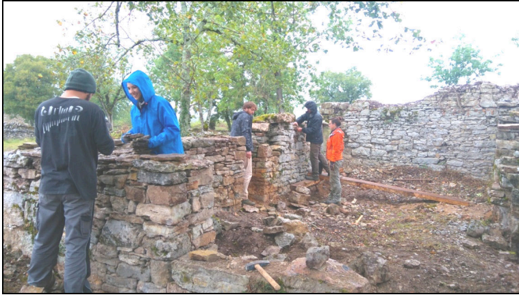
Les jeunes bénévoles à l'œuvre