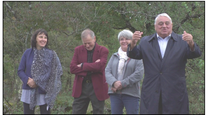
La verve du sénateur Jean-Claude Requier