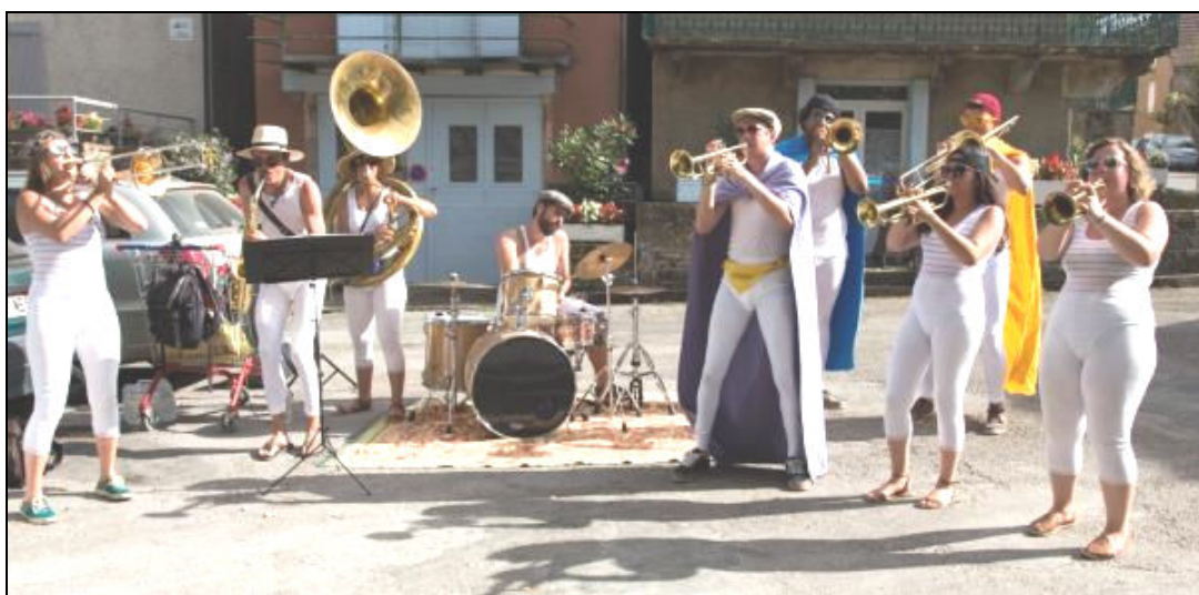
La sympathique fanfare en action

Le vendredi 4 août, une fanfare composée d'étudiants et diplômés de l'école d'architecture de Nantes, a animé le marché fermier. Son nom, Saucisses, lentilles , sied parfaitement à la manifestation estivale. Le succès de leur prestation lui vaut d'être invitée l'an prochain pour le plus grand plaisir des Miersois, Lotois et touristes.