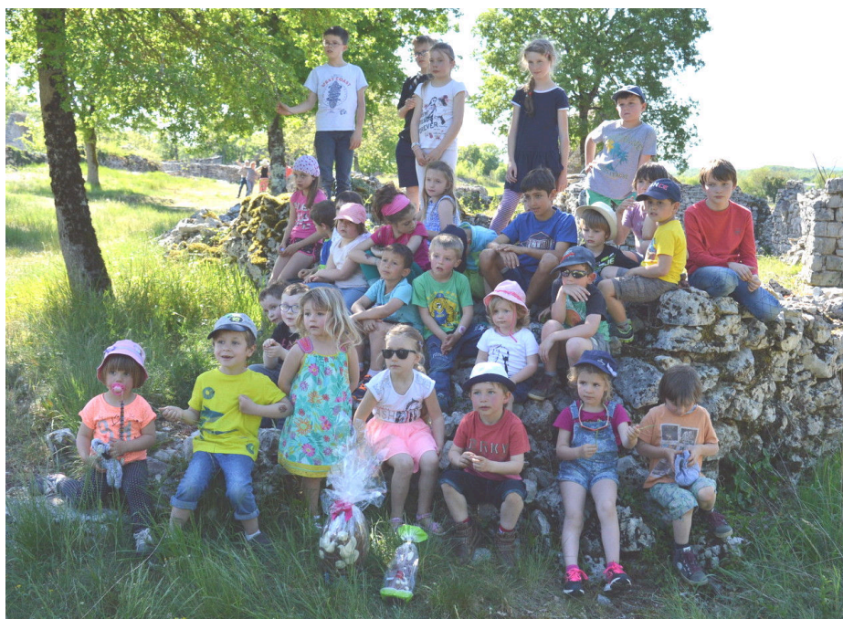
Chasse aux œufs – Hameau de Barrières (23/04/2017)

Ce printemps, l'APE a financé, entre autres, une sortie au train à vapeur de Martel pour les enfants de Rocamadour ainsi qu'une chasse aux œufs de Pâques au hameau de Barrières (Miers). Le soleil, les enfants et les parents étaient présents pour cette après-midi de chasse. Tout le monde a pu déguster un bon goûter chocolaté, pour le plaisir des petits et des grands. L'APE a aidé aussi à financer une visite au musée de Cuzals pour les enfants de Miers.