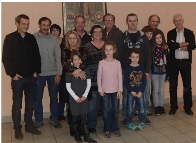
Une partie des membres des Amis de la source Salmière

10 octobre : Fête de la pomme avec les « Croqueurs de Pommes ». Petite restauration.